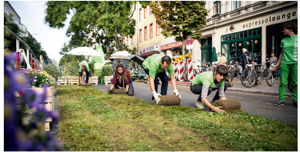
Greenpeace-Aktivist*innen verwandeln 2016 eine Hamburger Straße zum Naherholungsgebiet.

Deshalb fordert Greenpeace: Das Gemeinwohl muss ins Zentrum des Wirtschaftens gestellt werden!