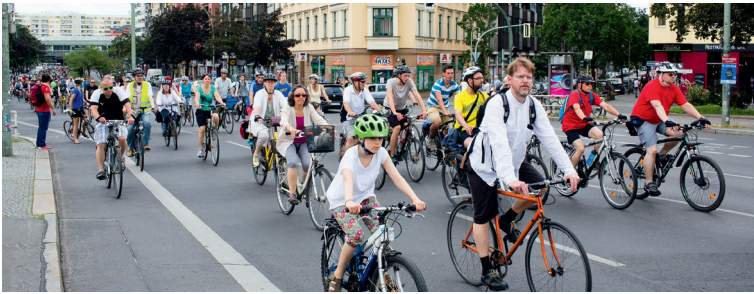
In die Pedale treten für eine Verkehrswende in Berlin 2016

Wie die Wirtschaft wieder den Menschen dient – und nicht dem Geld an sich