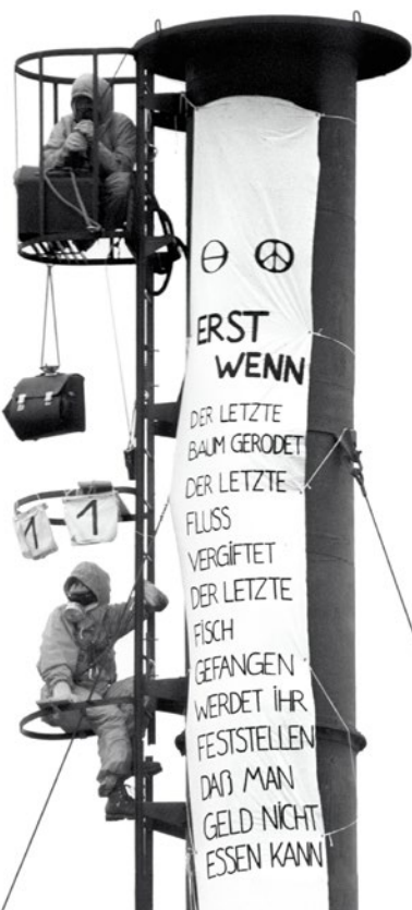
1981 – Greenpeace-Protest gegen die Giftschleuder Boehringer

1982 Die IWC beschließt das Verbot des kommerziellen Walfangs ab 1986. ▶ Krach im deutschen Büro über den Führungsstil: Einige Ehrenamtliche steigen aus und gründen Robin Wood.