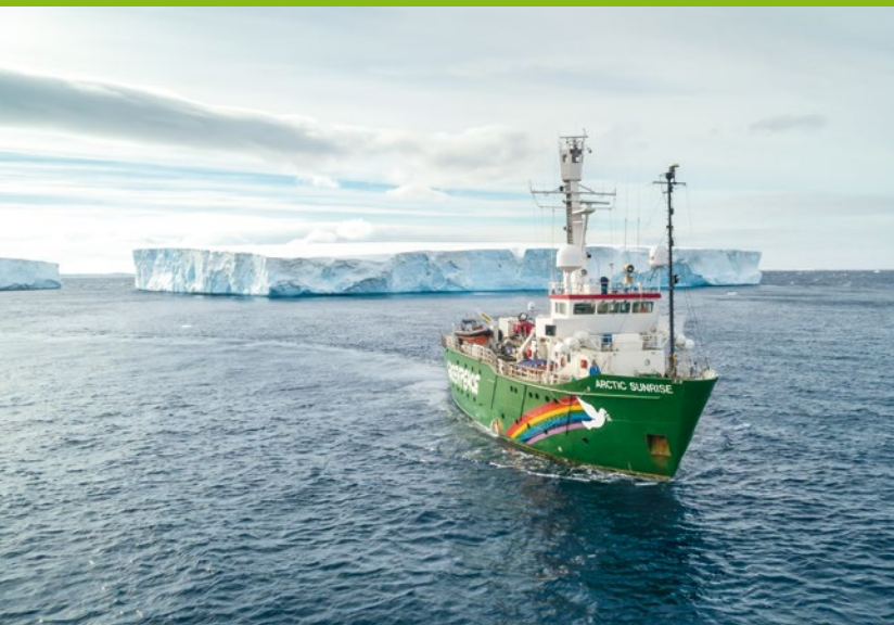
2018 – Greenpeace setzt sich für ein Schutzgebiet im antarktischen Weddellmeer ein

2018 Drei Millionen Menschen fordern mit Greenpeace ein Schutzgebiet im antarktischen Weddellmeer. Teilerfolg: Der Branchenverband der Krillindustrie erklärt, das Weddellmeer und wichtige Wildtiernahrungsgründe um die antarktische Halbinsel zu schonen. ► Die brasilianische Umweltschutzbehörde IBAMA erteilt dem französischen Ölkonzern Total eine Absage für Bohrpläne nahe dem Amazonasriff, gegen die sich Greenpeace eingesetzt hatte. ► Der Hambacher Wald soll für die Erweiterung des angrenzenden Kohletagebaus weichen – er wird im Herbst 2018 zum Symbol der verfehlten Energie- und Klimapolitik Deutschlands. Greenpeace protestiert mit Zehntausenden Menschen für den Erhalt des Waldes und für den Ausstieg aus der klimaschädlichen Kohleverbrennung.