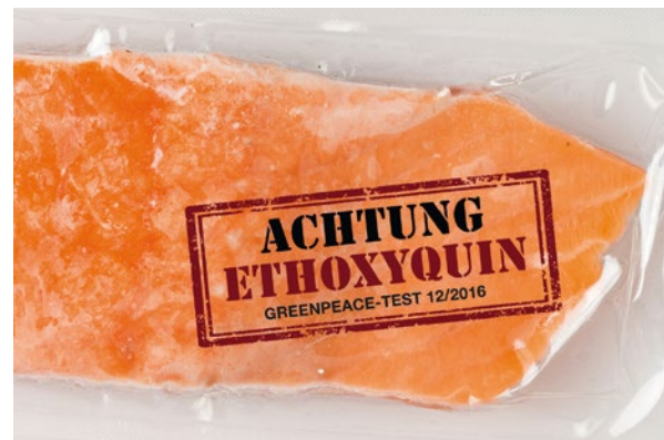
2016 – Greenpeace deckt auf: Speisefische aus Aquakulturen sind mit dem Pflanzenschutzmittel Ethoxyquin belastet