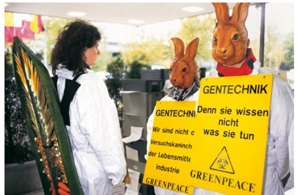
1997 – Greenpeace-Protest gegen Gentechnik in Lebensmitteln

▶ Konfrontation mit Heringsfän- gern im Ärmelkanal, die für die Überfischung der Nordsee mitver- antwortlich sind. Greenpeace stellt „Prinzipien für eine ökologisch verträgliche Fischerei“ vor. ▶ Seit 1971 engagieren sich Greenpeace- Aktivist*innen auf allen Ebenen gegen Atomversuche – nun einigt sich die UN auf einen Atomtest- stopp.