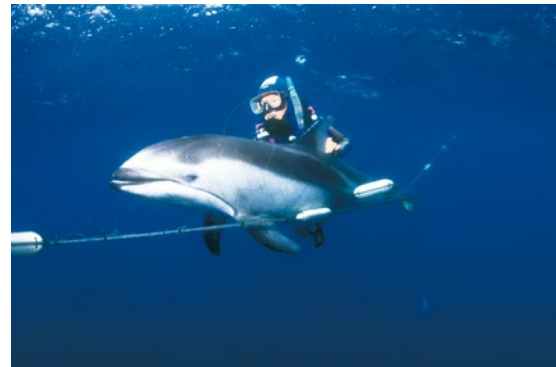
Seit 1983 – Aktionen gegen Treibnetzfisherei

1987 Eine Greenpeace-Antarktisstation wird etabliert. ▶ Greenpeace gründet das „Bergwaldprojekt“ mit, Freiwillige pflanzen Bäume gegen das Waldsterben.