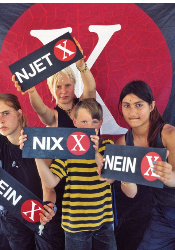
1998 – genetiXproject gegen Gentechnik

1999 Aktivist*innen enthüllen, dass die Raiffeisen eG mit Genmais von Novartis handelt. ▶ Deutsche Supermarktketten erklären im Zuge der Greenpeace-Proteste, bei ihren Lebensmitteleigenmarken auf Gentechnik zu verzichten. ▶ Nach der „Aktion Stromwechsel“ und im Zuge der Strommarktliberalisierung sucht Greenpeace einen Energie- versorger, der die strengen Ökostromkriterien der Umweltschutz- organisation erfüllt – erfolglos. So geht Greenpeace die Aufgabe selbst an: 1999 gründet sich Greenpeace Energy eG, im Januar 2000 läuft das Geschäft mit den ersten 186 Kunden an.