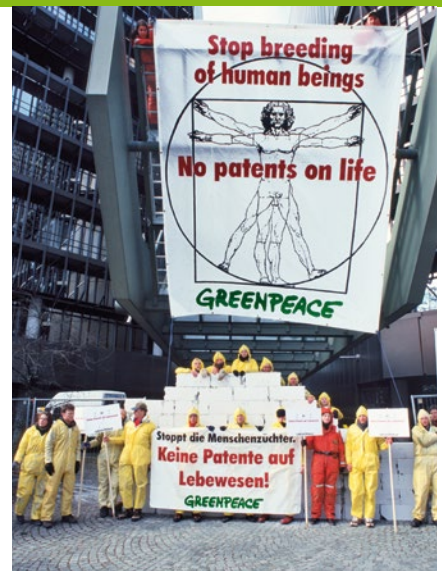
2000 – Protest am Europäischen Patentamt

2005 Der Ratgeber „Essen ohne Pestizide“ erscheint – auch er wird über die Folgejahre immer wieder aktualisiert und ergänzt. Er sensibilisiert Verbraucher*innen und initiiert Veränderungen auf dem Markt. ► Die Kampagne „SOS Weltmeer“ dokumentiert Überfischung sowie Verschmutzung der Meere und fordert echte Schutzgebiete. ► Mit einem Dinosaurier aus Schrott touren Greenpeacer*innen durchs Land, sie protestieren gegen die geplante Laufzeitverlängerung für deutsche Atomkraftwerke. ► Jahrelang hatte sich Greenpeace gegen Atomtransporte in die sogenannten „Wiederaufarbeitungsanlagen“ in Frankreich und Großbritannien stark gemacht – nun werden sie aus Deutschland eingestellt.