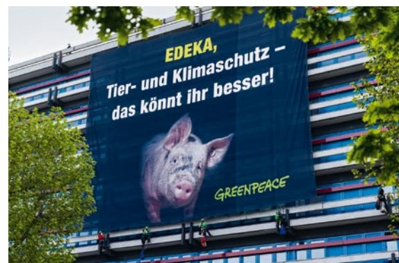
2021 – Protest gegen Edekas Fleischpolitik in Hamburg