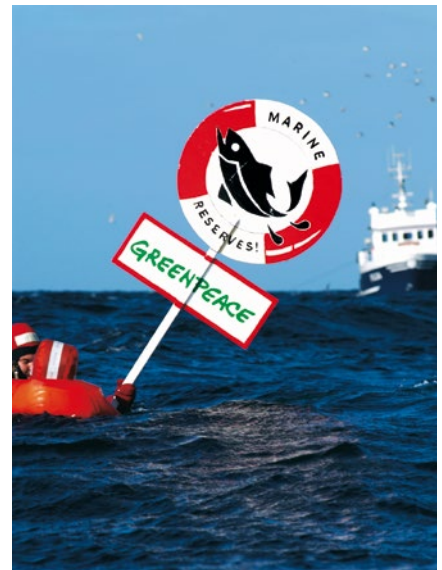
2004 – Einsatz für den Meeresschutz