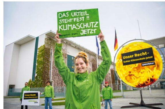
2021 – Freude über den Erfolg vor dem Bundesverfassungsgericht

2021 Historischer rechtlicher Erfolg: Das Bundesverfassungsgericht erklärt das Klimaschutzgesetz teilweise für verfassungswidrig und stärkt damit das Recht der jungen Generation auf eine lebenswerte Zukunft. Das Urteil erfolgte nach einer von Greenpeace unterstützten Klage von neun jungen Menschen. ▶ Deutschland tritt der “High Ambition Coalition for Nature and People” bei und setzt sich damit dafür ein, weltweit bis 2030 mindestens 30 Prozent der Land- und Meeresflächen zu schützen. ▶ Billigfleisch in Supermärkten wird zum Auslaufmodell – bis auf Kaufland wollen alle großen Händler langfristig kein Frischfleisch der qualvollen Haltungsformen 1 und 2 mehr verkaufen. Die Umstellung des Sortiments läuft: Innerhalb eines Jahres sank laut einer Greenpeace-Abfrage der Anteil der Haltungsform 1 von 69 auf 34 Prozent.