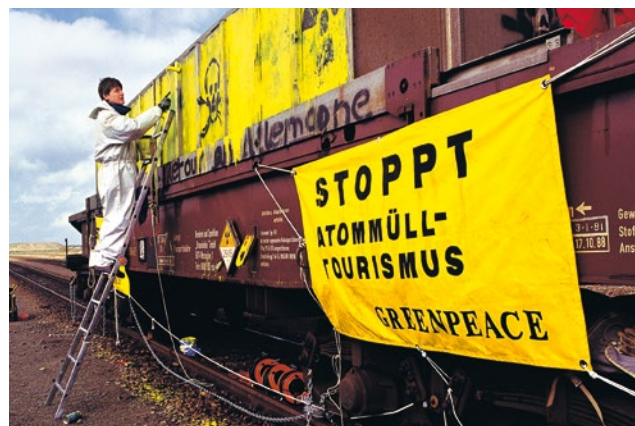
1991 – Protest gegen Atommülltransporte quer durch Europa