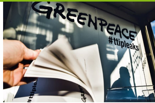
2016 – Einsicht in TTIP-Unterlagen: Ein gläserner Leseraum in Berlin schafft Transparenz

2017 Mit kreativen, friedlichen Protesten lenken Greenpeace-Aktivist*innen bereits Monate vor und während des G20-Gipfels in Hamburg die Aufmerksamkeit auf die zentrale Botschaft: „Planet Earth First“. ▶ Der Outdoor-Ausrüster Gore Fabrics erklärt, die gefährliche Chemikaliengruppe der PFCs ab 2023 aus seinen Gore-Tex-Produkten zu verbannen – ein Erfolg der Detox-Kampagne und ein eindrückliches Signal an die Outdoorbranche. ▶ Der Braunkohlekonzern LEAG gibt den neuen Tagebau Jänschwalde Nord auf – Greenpeace hatte sich mit der Bevölkerung jahrelang dafür eingesetzt. ▶ Millionen Menschen setzen sich mit Greenpeace im Rahmen der „Save the Arctic“-Kampagne gegen die industrielle Ausbeutung der Arktis ein, ein Erfolg: Die EU und neun Staaten einigen sich auf den Schutz des Nordpolarmeers vor der unregulierten, kommerziellen Fischerei, zunächst für 16 Jahre.