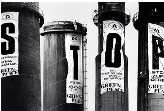
1984 – Protest an Kohlekraftwerken

1984 Greenpeacer*innen protestieren zeitgleich in acht europäischen Ländern an den Schloten von Kraftwerken, um ein Zeichen gegen sauren Regen und Waldsterben zu setzen.