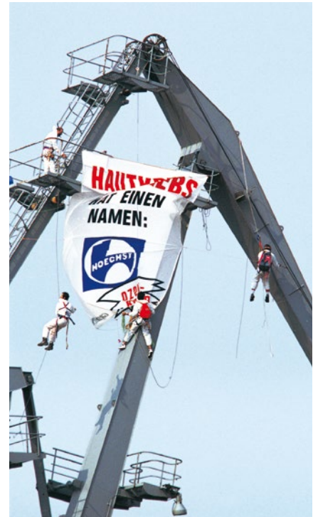
1989 – FCKW-Aktion bei Hoechst

1991 Das Antarktisschutzprotokoll, das den Rohstoffabbau für 50 Jahre verbietet, wird unterzeichnet. ▶ Greenpeace bringt ein Plagiat des „Spiegel“ heraus – auf chlorfrei gebleichtem Tiefdruckpapier. Die Verlage bestritten bis dato, dass das ohne Qualitätsverlust möglich sei. Nun wissen sie es besser. ▶ Die UN beschließen ein weltweites Verbot der Treibnetzfisherei.