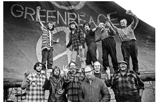
1971 – Erster Greenpeace-Protest gegen Atomtests

1971 Greenpeace gründet sich im kanadischen Vancouver: Eine Handvoll Umweltschützer sticht in See, um amerikanische Atomwaffentests auf der Insel Amchitka vor Alaska zu verhindern. Ab 1972 richten sich die Proteste auch gegen die französischen Atombombentests im Südpazifik.