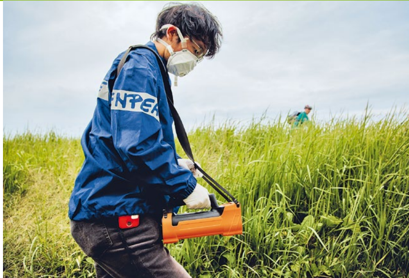
2011 – Nach dem Super-GAU im japanischen Atomkraftwerk Fukushima misst ein Greenpeace-Strahlenexperte die radioaktive Kontamination

2011 Im japanischen AKW Fukushima Daiichi kommt es zum atomaren Super-GAU. Greenpeace entsendet ein internationales Expertenteam, um unabhängige Messungen vorzunehmen und die Ergebnisse der Öffentlichkeit zur Verfügung zu stellen. Greenpeace ist bis heute kontinuierlich vor Ort aktiv und setzt Impulse für die Energiewende in Japan. ► In Deutschland wird der Atomausstieg beschlossen. ► „Der Plan“ ist das Greenpeace-Szenario für einen kompletten Umstieg auf erneuerbare Energien in Deutschland. ► Flüsse und Ozeane werden durch Chemikalien belastet, die bei der Textilproduktion verwendet werden. Die Detox-Kampagne beginnt 2011 und erzielt über Jahre einen Erfolg nach dem anderen. Sie ist ein Weckruf für die gesamte Branche und initiiert enorme Veränderungen.