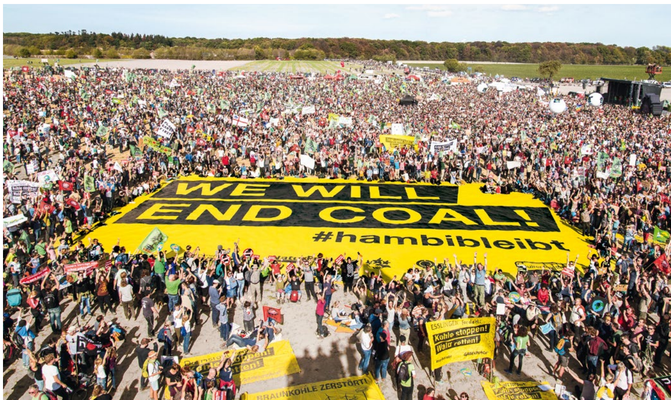
2018 – Zehntausende protestieren am Hambacher Wald für Klimaschutz und feiern den vorläufigen Rodungsstopp

2019 „Greenwire“, die Mitmachplattform für Greenpeace-Ehrenamtliche und andere Umweltaktive, geht online. ► Eine globale Schiffsexpedition deckt die Bedrohung der Ozeane auf und drängt auf ein internationales UN-Abkommen zum Schutz der Hohen See. ► Drei Familien, deren Lebensgrundlage von der Erderhitzung bedroht ist, klagen gemeinsam mit Greenpeace für wirksamen Klimaschutz. ► Der Berliner Senat lässt die gängige Schweinehaltung vom Bundesverfassungsgericht prüfen. Auslöser für die Normenkontrollklage, die nur ein Bundesland auf den Weg bringen kann, war ein von Greenpeace veröffentlichtes Rechtsgutachten. ► Russland stellt das Herzstück des Dvinsky-Urwaldgebietes unter Schutz. Dafür hat sich Greenpeace jahrzehntelang eingesetzt. ► Die Klimaschutzbewegung wächst enorm – das ist Hoffnung und Motivation für all die Greenpeace-Aktivist*innen, die sich weltweit und über Jahre gegen Kohle, gegen eine klimaschädliche Verkehrs- und Agrarpolitik, für saubere erneuerbare Energien und mehr politischen Mut eingesetzt haben!