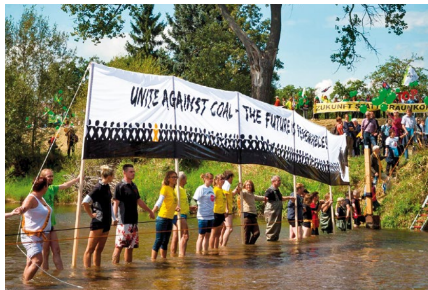
2014 – Lausitz: Demonstration gegen Kohletagebaue

2015 Raus aus den fossilen Energien: Bei der Klimakonferenz in Paris werden ambitionierte Ziele gesetzt. ► Proteste von Greenpeace und Verbraucher*innen zeigen Wirkung: Wiesenhof und McDonald's wollen künftig gentechnikfreies Hühnerfutter nutzen.