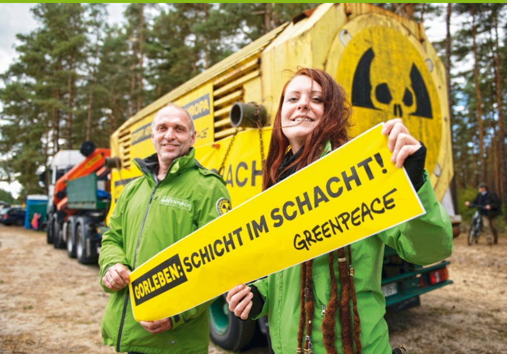
2020 – Gorleben ist Geschichte!

2020 90 Gebiete in Deutschland haben nach Erkenntnissen der Bundesgesellschaft für Endlagerung günstige geologische Voraussetzungen für ein Atommüllendlager. Gorleben ist nicht darunter. Jahrzehntlang hatten Umweltschützer und Geolog:innen auf Sicherheitsmängel hingewiesen – nun ist amtlich: Gorleben ist als Endlager ungeeignet. ▶ Die Automobilbranche geht bei der finanziellen Unterstützung anlässlich der Covid-19-Pandemie trotz vehementer Forderungen beim Verkauf von Verbrennerfahrzeugen leer aus. ▶ Mehr wilde Wälder in Bayern! Auf nun insgesamt 58.000 Hektar wird die Natur sich selbst überlassen, eine Fläche sieben Mal so groß wie der Chiemsee. Der Haken: 98 Prozent der Flächen sind winzig! Zusätzlich braucht es große Naturwälder ohne Baumfällungen im Spessart und Steigerwald. ▶ Die Bundesregierung verlängert ihr Waffenexportembargo gegen Saudi-Arabien um ein Jahr und widerruft bereits bestehende Genehmigungen. Alle Rüstungslieferungen, die seit dem Exportstopp im Jahr 2018 on hold waren, werden nicht mehr weiter durchgeführt.