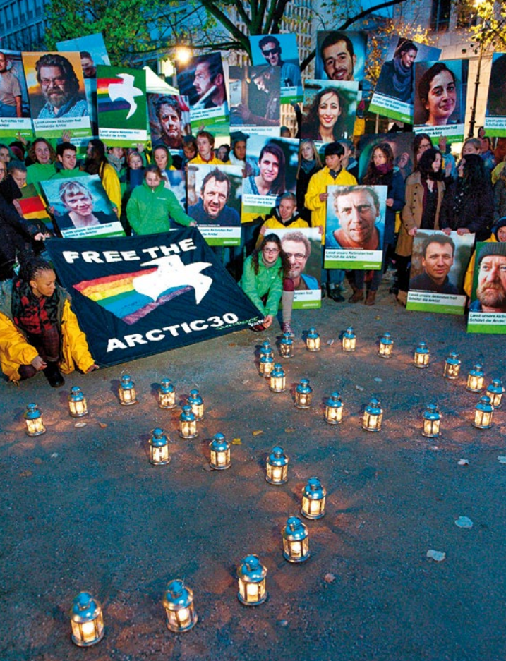
2013 – Proteste gegen Ölbohrungen in der Arktis und für die Freilassung von Aktivist*innen aus russischer Haft

2012 Ein Greenpeace-Schiff kreuzt vor der Westküste Afrikas, Aktivist*innen protestieren gegen die Ausbeutung dortiger Fischgründe durch subventionierte europäische Riesentrawler – die zeitnahe Reaktion: Senegal hebt 29 Fischereilizenzen für nicht afrikanische Trawler auf.