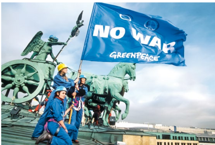
2003 – Greenpeace-Aktion auf dem Brandenburger Tor gegen den drohenden Irakkrieg