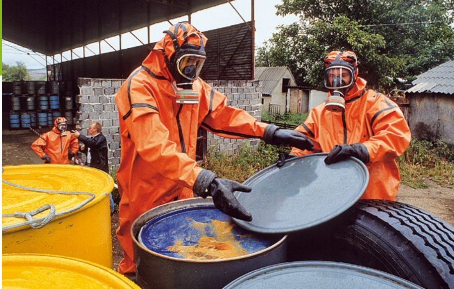
1992 – Giftmüllrückholaktion in Rumänien

► Aktivist*innen bringen dem deutschen Umweltminister radioaktiv kontaminierten Sand aus der Umgebung der britischen „Wiederaufarbeitungsanlage“ Sellafield, die auch deutschen Atommüll verarbeitet.