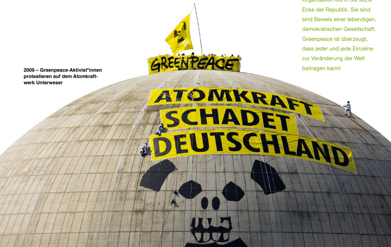
2009 – Greenpeace-Aktivist*innen protestieren auf dem Atomkraftwerk Unterweser

GREENPEACE MOTIVIERT ZUM UMWELTENGAGEMENT, zum kritischen Umgang mit Institutionen und damit gegen Politikverdrossenheit und Resignation. Tausende Kinder, Jugendliche und Erwachsene, die sich ehrenamtlich für Greenpeace-Themen einsetzen, tragen die Arbeit der Organisation bis in die letzte Ecke der Republik. Sie sind sind Beweis einer lebendigen, demokratischen Gesellschaft. Greenpeace ist überzeugt, dass jeder und jede Einzelne zur Veränderung der Welt beitragen kann!