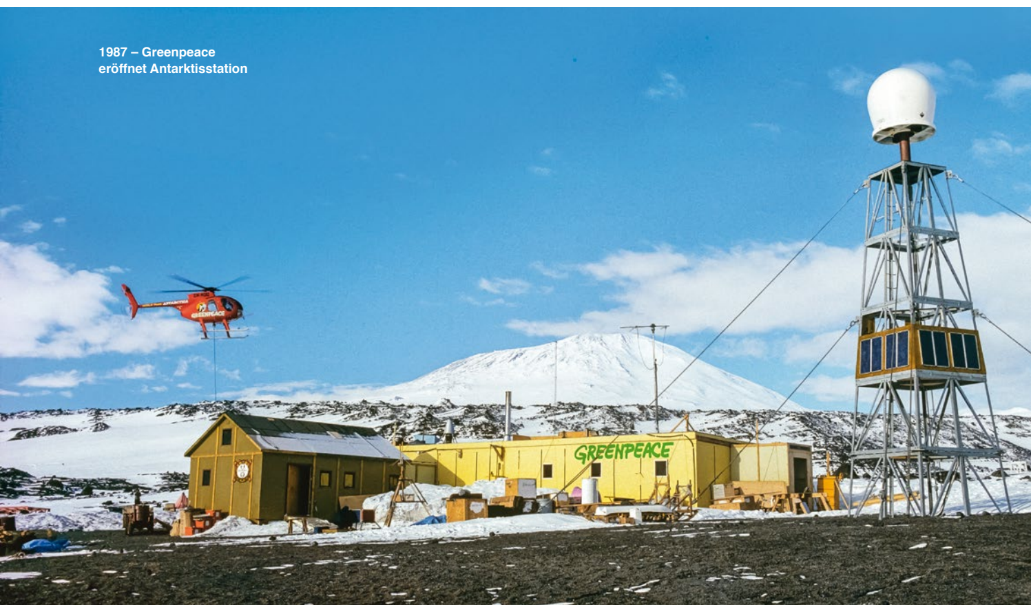
1987 – Greenpeace eröffnet Antarktisstation