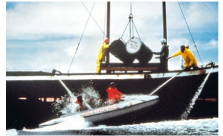
1981 – Aktion gegen Atommüllversenkung

Greenpeace-Kampagnen erzielen teils beachtliche Erfolge, wie etwa beim „Weltpark Antarktis“. Und Greenpeace-Lösungen zeigen immer wieder ganz konkret, dass es auch anders geht – Beispiele sind der klimafreundliche Kühlschrank „Greenfreeze“ oder das Spritsparauto „SmLE“. Greenpeace arbeitet mit anerkannten Instituten zusammen, um mögliche Wege in die Zukunft aufzuzeigen – von Energieszenarien und Vorschlägen, wie eine Verkehrswende gestaltet werden kann, über eine „Waldvision“ bis hin zu konkreten Schritten in Richtung einer echten Agrarwende.