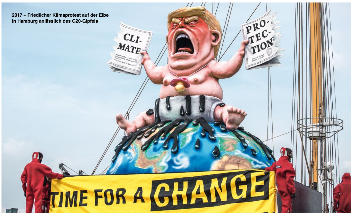
2017 – Friedlicher Klimaprotest auf der Elbe in Hamburg anlässlich des G20-Gipfels